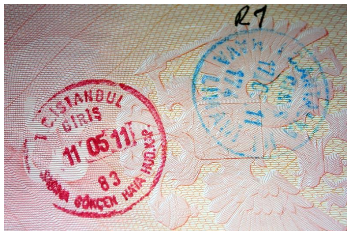
Образец штампа при въезде в Турцию в целях туризма и бизнеса

Гражданам Таджикистана желающие посетить Турцию, настоятельно рекомендуется ознакомиться с информацией о турецких визах и визовом режиме в целом до того, как они решат въехать в страну.